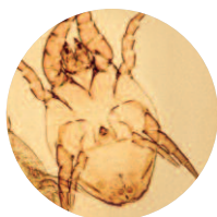
D. farinae mâle