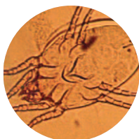
D. pteronyssinus femelle

Avec notamment Dermatophagoïdes pteronyssinus , Dermatophagoïdes farinae et Euroglyphus maynei , qui sont les espèces les plus répandues.